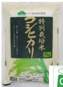
滋賀県産こしひかり